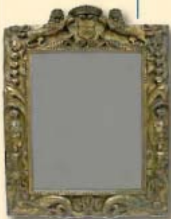
De spiegel in de vestiaire met het wapen van Van Wittenhorst.