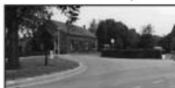
Kruis Ninnesweg 1983