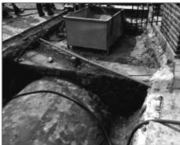
Het tongewelf van de tweede kelder (Neerhofniveau).

Dit is de stand van zaken betreffende Kasteel De Keveberg in de tweede helft van november 2013.