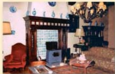
De grote kamer