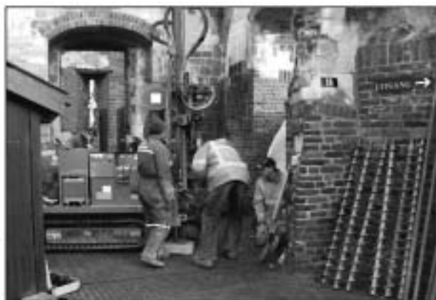
Grondboringen in de grote toren.

Hierin is de lift gepland waarmee alle verdiepingen van het kasteel toegankelijk worden. Vanaf de Neerhof, zeg maar begane grond, tot en met de zolder. Een totale hoogte van meer dan 22 meter. De weggegraven grond werd gezeefd en de vondsten zorgvuldig bewaard. Ook het muurwerk dat vrij kwam werd ingetekend, gefotografeerd en door de bouwhistoricus André Vierssen nauwkeurig beschreven en gerapporteerd.