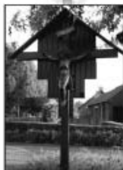
De huidige situatie