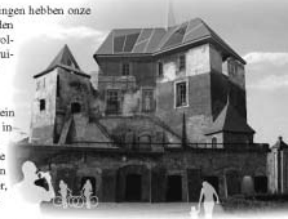
De burcht na voltooiing van de herbouw.