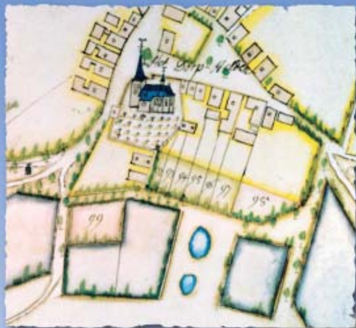
Helden 1734 detail tiendenkaart

Historisch tijdschrift van Heemkundevereniging Helden