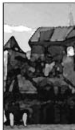
De huidige 12de eeuwse aanblik van de kunstmatige heuvel met daarop de ronde mergelstenen weermuur.