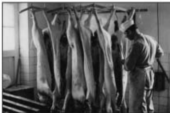
In 1970 wordt gestopt met het slachten in de slachterij.