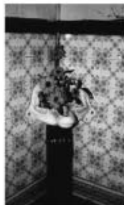
Het versierde urinoir