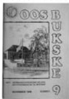
Omslag 'Oos Bukske'