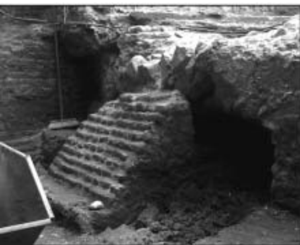
De poer of stiep tegen de rondboogfundering uit de 12de eeuw.

In deze toren vond men op 1 meter diepte de fundering van overwegend Maaskeien terug van de grondbogen van de ringmuur. Rond ca. 1350 had men het gedeelte van de weermuur dat boven de grond kwam afgebroken ten behoeve van de aansluiting van de grote toren. In de burchtheuvel liet men de boogfundering zitten. Tegen deze fundering had men ter versterking een ca. 1 m hoge en 1 m brede stiep (steunpilaar) van baksteen gemetseld. Tot zover had professor J. Renaud in de periode 1950 - 1955 de toren ook ontgraven. Nu men dieper groef ging men ook verder terug in de tijd en op ca. 4 m diepte stootte men op de