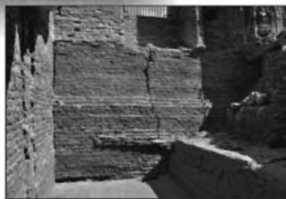
De ontgraving in de grote toren.