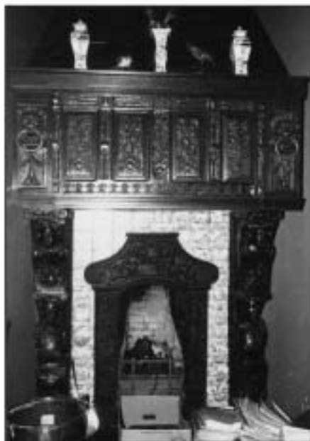
De fraaie schouw van de open haard in de jachtkamer.