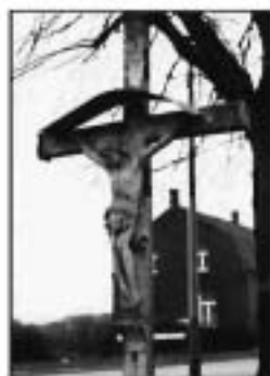
Het oude betonnen kruis