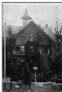
De grote kamer

Alle tien kinderen groeiden in dit grote huis op. Als oudste kleinkind heb ik in mijn jeugdjaren veel tijd in de Villa doorgebracht. Ik was toen al zeer geboeid door de grote hoeveelheid kunst en antiek die in het grootouderlijk huis te vinden was. Deze fascinatie heeft zeker invloed gehad op mijn latere beroepskeuze: sinds 1975 ben ik antiquair en taxateur in