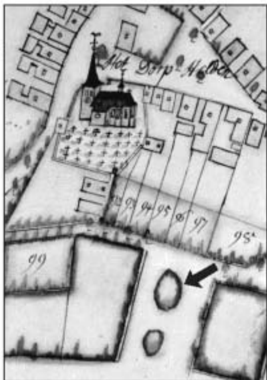
Tiendenkaart uit 1734. (Uitsnede Helden-Dorp met de Pastoorswijer, zie pijl.)

Het ven zal wel aan die naam gekomen zijn omdat de pastoor van Helden er het vистrecht had. Al heb ik nooit enig document hierover gezien, toch lijkt dit me de voor de hand liggende verklaring voor de naam.