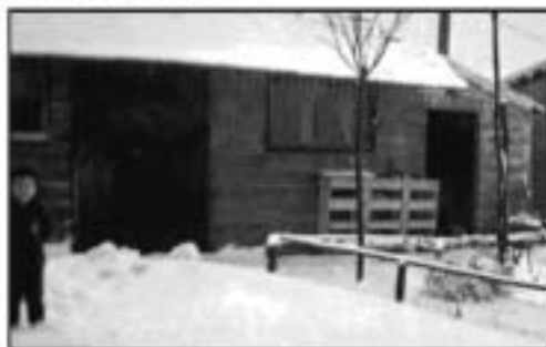
Het roodstenen schuurtje met daarin de drie varkensstallen. Rechts de deur van het washok waar de gesloten ruimte was van het rookhokje.

Geld voor een goed geoutilleerde winkel en werkplaats was er ook nog niet; er moest eerst verdiend worden. Twee hokken op het erf gevuld met kippen gingen daarbij helpen. De kippenhouderij bloeide in de vijftiger jaren. Naast de kippenhokken lag de groentetuin en daarachter nog 20 are akkerland waar aardappelen en/of bieten werden geteeld. Het ploegen, poten, zaaien en oogsten werd naast de andere werkzaamheden tot ongeveer 1960 volgehouden.