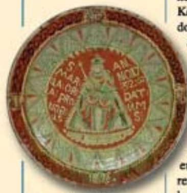
De aardewerken schotel

De blik van de bezoeker van de grote kamer kon niet ontkomen aan een grote hoeveelheid blauwe borden aan de muren en dito vazen op kasten en piano. Er zat niet veel lijn in. Delfts aardewerk stond naast Chinees porselein, en Japanse stukken waren broederlijk verenigd met Engels Wedgewood. Een beslist erg fraai en interessant object bevond zich in een hoek, boven de piano. Het was een grote Nederrijns aardewerken schotel met de afbeelding van de Lieve Vrouwe van Kevelaer, die blijkens het opschrift in 1732 vervaardigd was door Paulus Kuijpers, een pottenbakker die werkzaam was in Sevelen, nu gelegen vlak over de Duitse grens, toen evenals Helden deel uitmakend van Pruisisch Opper-Gelder. Van deze schotel wordt gezegd dat ze een huwelijksgegeschenk aan een der voorvaderen was. De plaats Sevelen ligt op enkele kilometers afstand van het dorp Aldekerk, waar de voorouders van de familie Haffmans woonden voordat ze rond 1800 in westelijke richting de Maas overtrokken. Het aanzien van de grote kamer werd gecompleteerd door enkele grote meubels zoals een fraaie beeldenkast uit de renaissance, een barokke kussenkast, een fijnhouten cilinderbureau met fraai inlegwerk, en een grote eettafel waarvan de poot versierd was met rijk beeldhouwwerk.