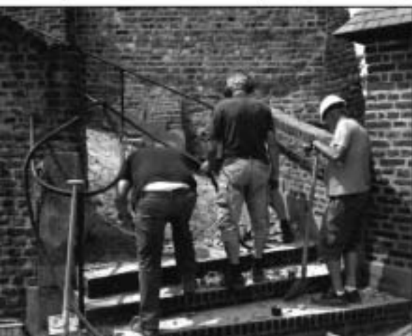
Op zoek naar de fundering van de grote toren.

versteft voor een veilige verdere ontgraving. Er is nog 6 m te gaan! Momenteel wordt aan deze constructie gewerkt. Onze vrijwilligers en amateurarcheologen zijn heel benieuwd wat ze daar tegen zullen komen! In februari hoopt men deze klus geklaard te hebben.