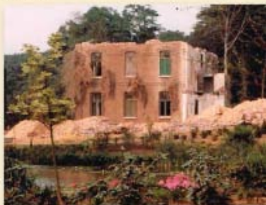
Het einde van de Villa.