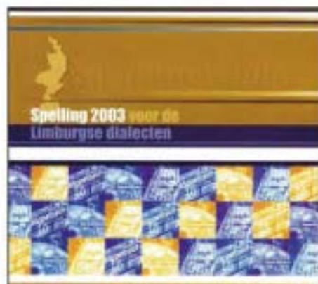
De omslag van het boekwerkje.

dialect is? Een boekwerkje waarin de spelling van Limburgse dialecten duidelijk uitgelegd wordt is nog steeds te verkrijgen via www.limburgsespelling.nl .