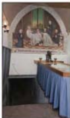
De toegang tot de grafkelder.