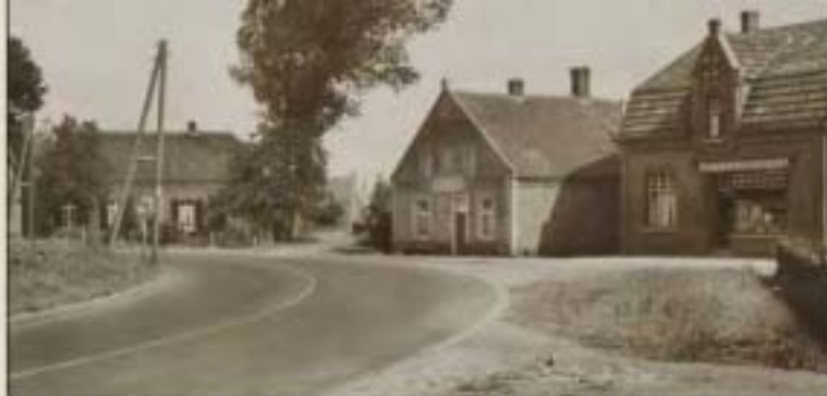
De Van Hövellstraat richting Panningen met rechts bakkerij Van Essen.