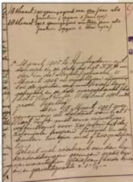
Een fragment uit het stamboek van het Nederlandse leger.

Nederlands Indië werd sinds 1941 door de Japanners onder de voet gelopen. Ties schrijft in zijn brief over de verovering van Ambon door de Japanners en de internering van alle Europeanen in het plaatselijke kamp Tan Toei op 29 januari 1942.