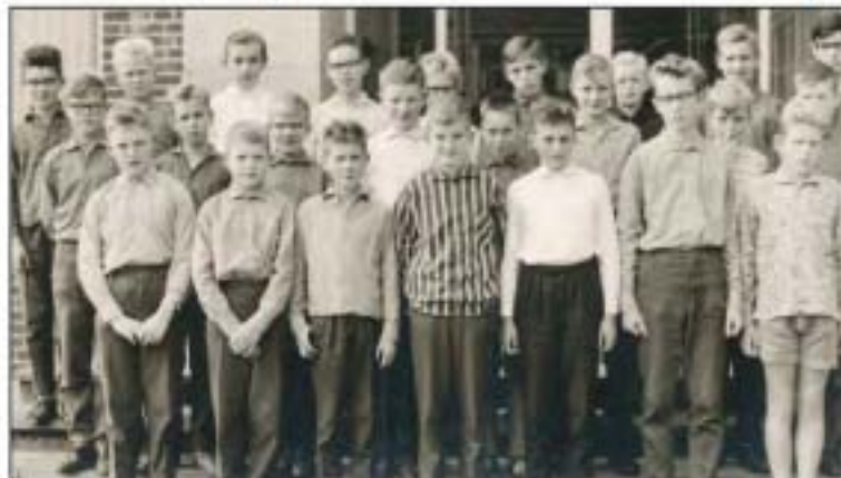
LTS 1963-1964 klas IA. Voor de namen zie de website.