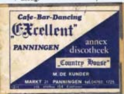
Het 'zwaegelduéske' van discotheek Excellent.

Knalpijpen, te grote tandwielen en gemanipuleerde carburateurs werden door de politie in beslag genomen. En daar stond je dan! De vindingsrijkheid van de bendeloden was echter vaak groot, en dus werd er soms een knuppel in de uitlaat gestoken