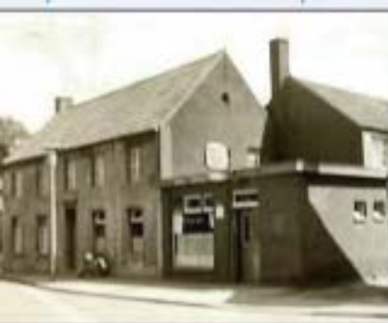
Zaal Aerds in de jaren zestig.

Op zaterdagavond en zondag was het ontmoetingstijd, dan kwamen uit alle hoeken en gaten de tieners op de bromfiets naar de centrale ontmoetingsplek bij uitstek: de Poolbar in Heiden. Kort daarna werd café-zaal Aerds (Apollo) aan het Mariaplein the place to be.