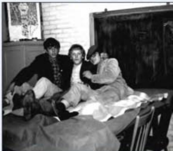
Links de auteur van dit artikel in een vreemde slaapplegenheid.

www.youtube.com . U typt in Matthew's Southern Comfort - Woodstock.