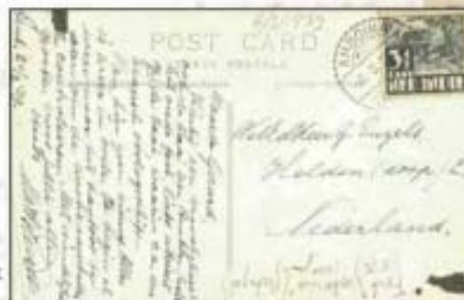
Een briefkaart van Ties aan Graad Engels.