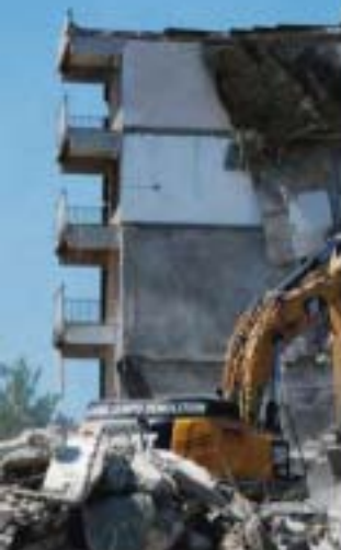
De afbraak van De Wietel in mei 2015.