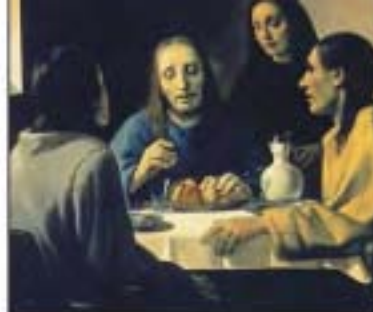
Het originele schilderij De Emmaüsgangers van Han van Meegeren.