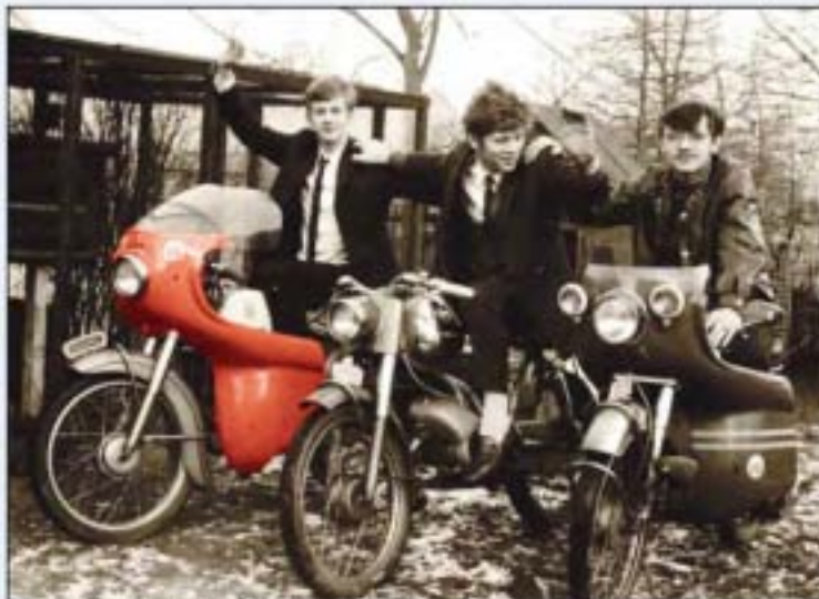
Enkele leden uit Meijel.