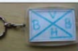
De sleutelhanger met het logo.