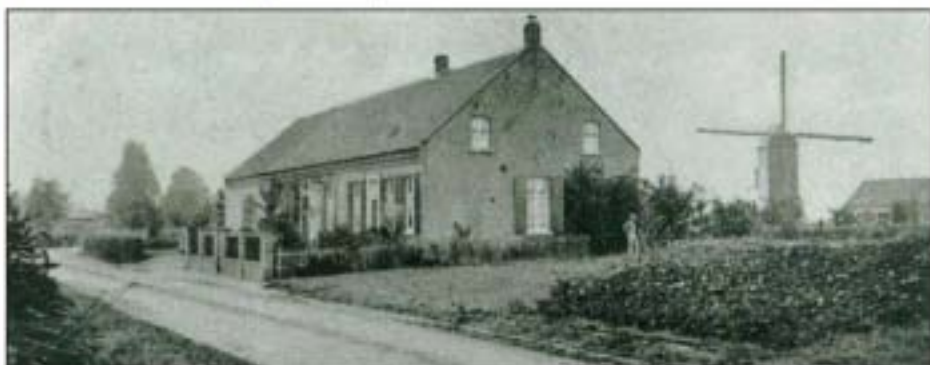
Molenzicht Everlo 1889.

Op 13 november 1889 koopt Pius Reijnen samen met zijn vader de molen 'Molenzicht Everlo' en begint daar als molenaar. Hij maalde en verkocht meel en zaaizaden en ook een