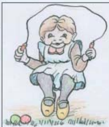
Tekeningen: Lei Smeeghs

Dae dao achter zaat waas t'r leechtig eine dae keps waas. Dae dae cent um gójde dae zat um wer op nej.