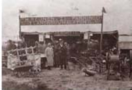
De presentatie tijdens een landbouwbeurs in de jaren 30.