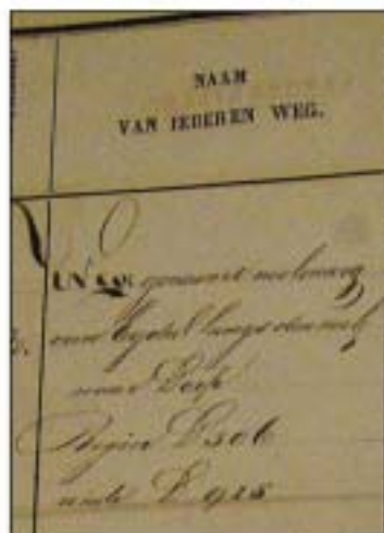
De Molenweg in de wegenlegger van 1842, onder no. 16.