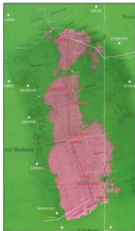
Kaart Draeck 1716.

en vier nieuwe palen met inscripties. Tevens moesten de dorpelingen een sloot graven tussen de grenspalen. De nieuwe grens vormt tot op de dag van vandaag al 300 jaar de provinciale grens.