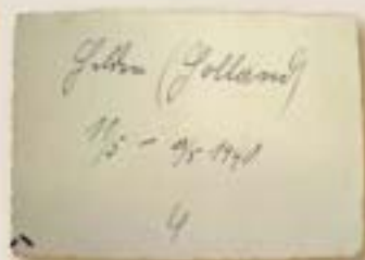
De achterzijde van een foto waarop staat: Helden (Holland) 11/5-13/5 1940.