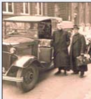
Met de taxi door Liverpool.