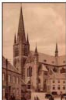
De kerk van Neer.

Pinksteren. Elk jaar was dit de dag dat wij vanuit Helden - Dorp een bezoek brachten aan onze familie in Scharn - Heer (nu Maastricht), want daar was het kermis. Men moest zijn zondagsplicht vervullen, dus sprongen mijn ouders in alle vroegte, met degenen van de kinderen die aan de beurt waren om mee te gaan, op de fiets, om op tijd in Neer te zijn voor het bijwonen van de eerste mis die om half zeven begon. De fietsen waren nog zonder versnellingen en je moest dus alle kracht bijzetten, zeker als je een kind achterop had. Na de mis werden de meegenomen boterhammen opgegeten, want je moest nachter blijven om ter communie te kunnen gaan: vanaf middernacht mocht je niets meer eten of drinken, en daar hield je je strikt aan.