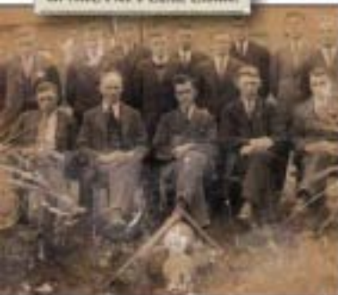
De Kuiters tijdens de oprichting in 1933.

Heden werd opening van café Beugelbaan. De geest van alle te versieren. Helden. Afdrukt. G. HOUTAPPELS, Eindhoven.