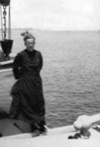
Bij het verlaten van Recife.