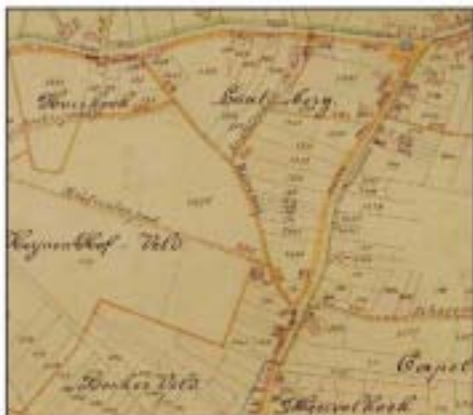
De Molenweg (1894).