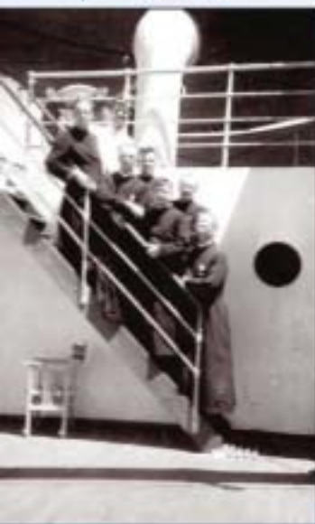
De zeven missionarissen.