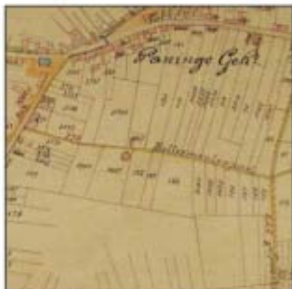
Het Bollesmeulenpad (1894).