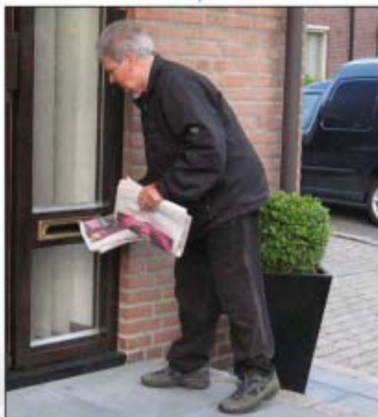
Mit dank aan Fien Hermans-Verstappen.