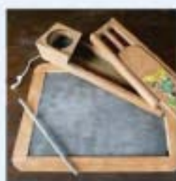
Lei en griffel