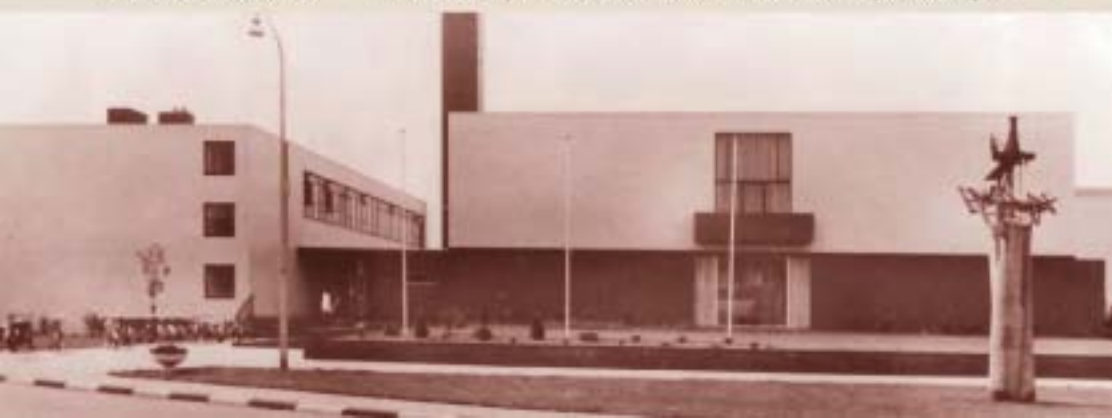
Het gemeentehuis begin jaren zeventig.