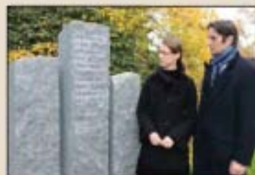
De familie Bernadotte bij de onthulling van het gedenkteken op Mainau.

tyfus en dysenterie op 18 juni 1945 te Mainau' (Akte nr.84 van overlijden opgemaakt 10-08-1945 gemeente Helden.). 'Begraven op het eiland Mainau. In 1946 is hij overgebracht en herbegraven op een speciaal daarvoor ingericht gedeelte voor slachtoffers met de Franse nationaliteit op het 'Konstanzer Hauptfriedhof'. (Algemene begraafplaats Konstanz. Akte A Konstanz SII 16393.)