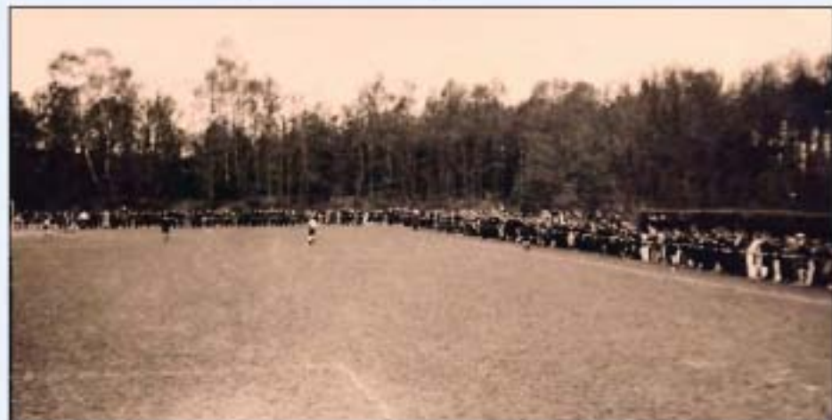
Het eerste voetbalveld van S.S.S.