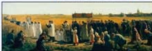
Processie door het veld.