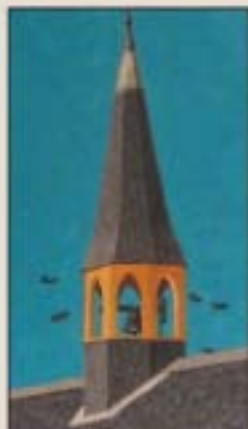
Detail uit het schilderij van Harrie Kranen van het oude Raadhuis.

Boven, het interieur van de kerk van Fortaleza in 1960, met het klokje.