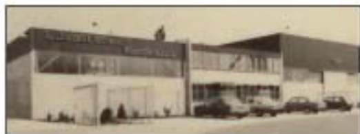
Het pand waar van 1978 tot 1984 het bedrijf gevestigd was. Onderstaande foto's zijn gemaakt tijdens de opening.