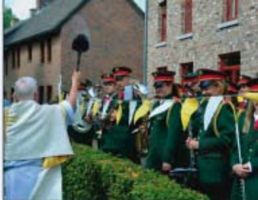
Wijwaterzegening van uniformen.