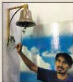
Het klokje anno nu.