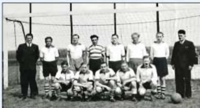
Kampioensploeg S.S.S.-voetbal Helden-Dorp 1949.