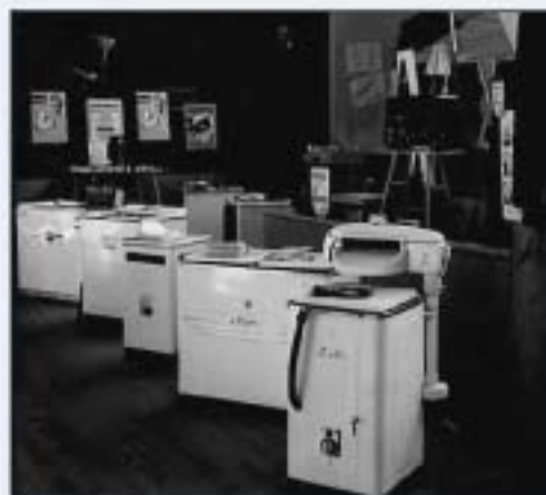
De beursstand van Electro Hermans op een middenstandstentoonstelling in 1958.

diende gulden werden besteed aan televisies, radio's, wasmachines, diepvriezers etc.