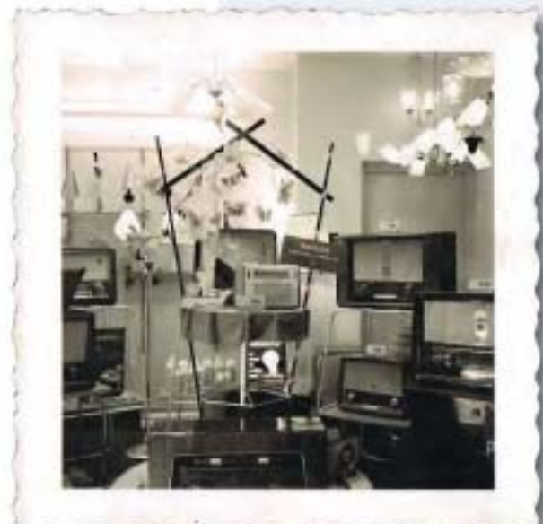
De winkel in 1958.