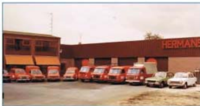
Mariaplein 13. Straatkant en achterzijde.