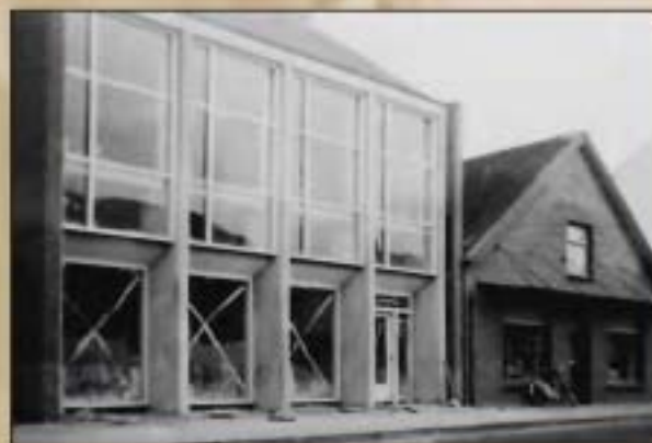
Het nieuwe winkelpand van Gerrit naast de oude winkel.