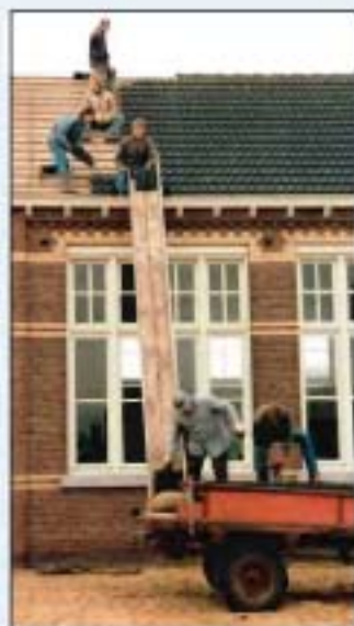
In 1986 wordt de H. Hartschool van Grashoek gesloopt. Hier door leden van Handboogschutterij OVU. Het dak van een nieuw doelhuis wordt de volgende bestemming van de pannen.