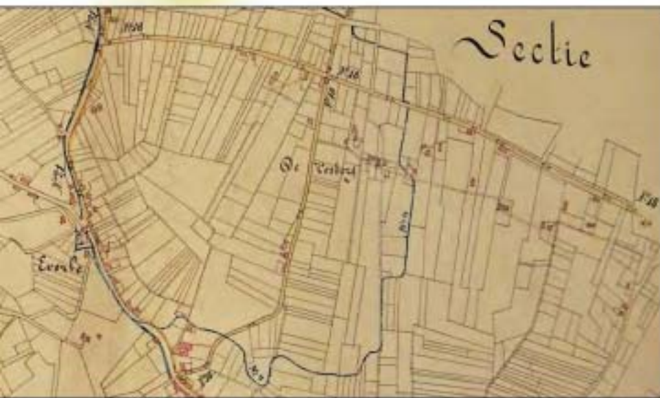
Kaart pfm. 1842

van een vuile weg, zeker niet in de tijd dat de naam ontstaan is. De wegen in de gemeente Helden zijn dan paden en karrensporen. We komen de naam 'Voelstraat' voor het eerst tegen in de wegenlegger uit 1842.