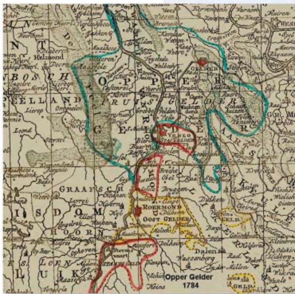
Opper Gelder in 1784.

ringskanaal tot en met Venray, telde circa 20.000 inwoners, waarvan er circa 800, 4% van de bevolking, in militaire dienst moesten opkomen. De helft van dit aantal keerde niet meer terug, sneu-