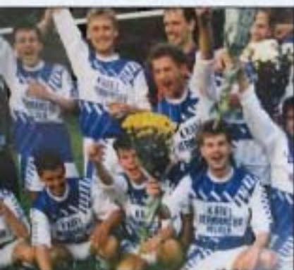
V.V. Helden in de clubkleuren met het logo van Karel Hermans B.V.