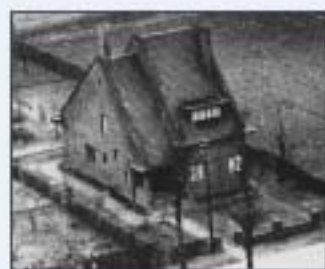
Het onderduikadres in Grashoek waar pater Bleijs verschillende weken heeft 'gelogeed'.