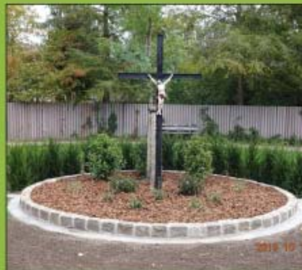
De nieuwe plek voor het Neessenkruis.