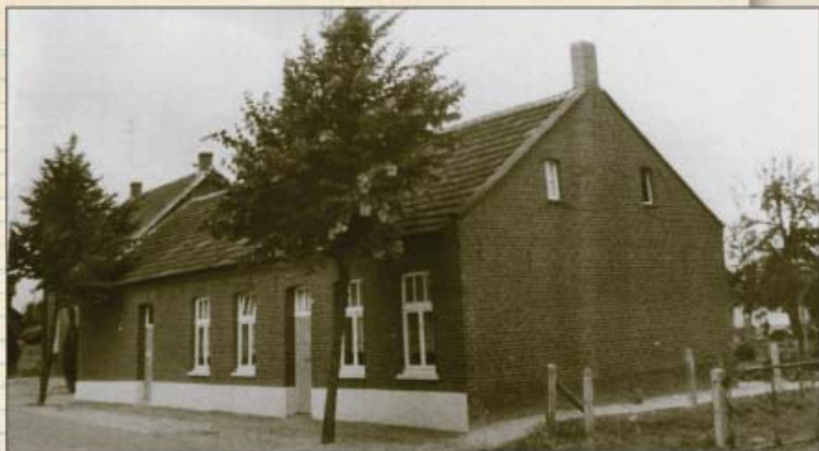
Het ouderlijk huis van de familie Ebisch-Nelissen.

hok. Viermaal per jaar werd er geslacht. Gradje Mewiss met z'n zoon Giel verrichtten deze ceremonie.