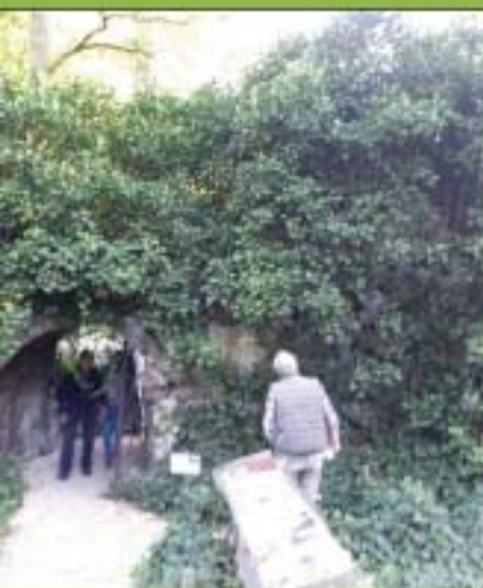
De Mariagrot vóór de 'behandeling'.

uiterlijk van de kapellen en kruisen aan te pakken, om vervolgens een plan van aanpak te gaan maken voor herstelwerkzaamheden aan de kruisen en kapellen, zoals dat in het onderhoudsplan van de gemeente van 2016 is vastgelegd. Bij diverse kruisen en kapellen is inmiddels