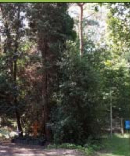
De oude plek van het grafmonument Neef met de grote coniferen.