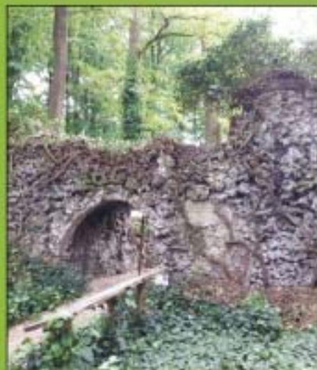
De Mariagrot na de 'behandeling'.