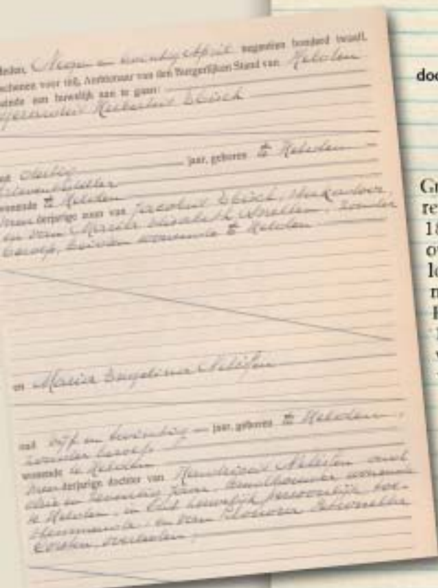
Trouwakte 29 april 1912.