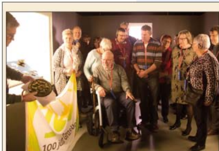
Leden van de Historische Werkgroep Grashoek poseren met de replica van de sierschijf van Helden voor de vitrine met phalera uit Dacië.