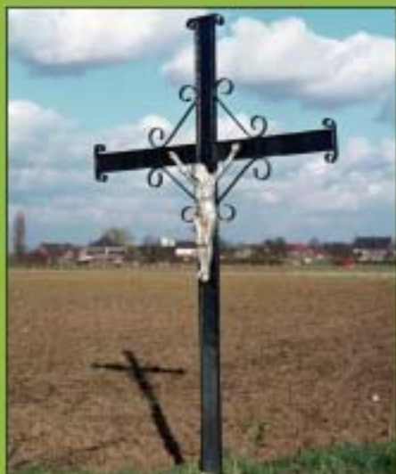
Het Neessenkruis in 1977 op de oorspronkelijke plek in de Riet.