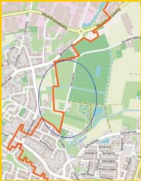
De oranje lijn is de parochiegrens.