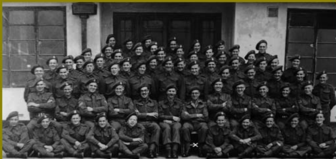
Artillery C Troop 414 S/L Battery.