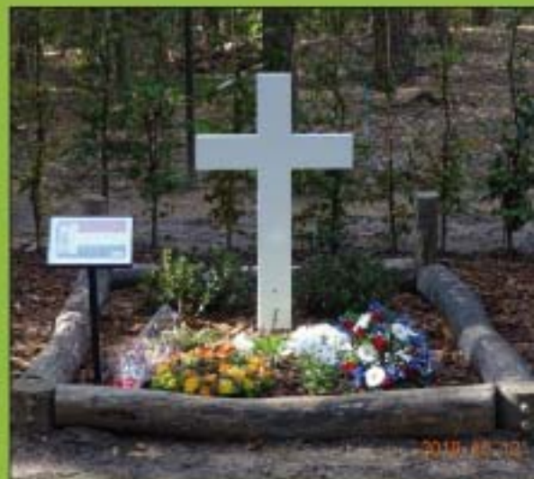
De nieuwe omgeving van het grafmonument Neef.

het overvloedige groen, kon men constateren dat de grot behoorlijk aan verval onderhevig was. Ook bestond de zogenaamde Calvarieberg nog. Alleen het kruis en de twee beelden stonden er niet meer op. De werkgroep besloot om eerst het