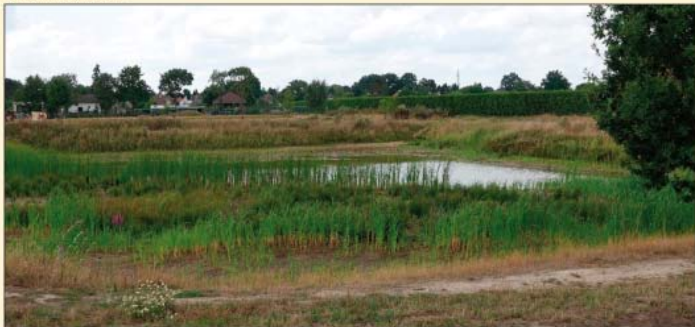
Het bergbezinkbassin nabij de Deinderik in 2019.

In 1992 is door de gemeente Helden gekozen voor de straatnaam Deinderik. De motivatie om te kiezen voor die naam: genoemd naar een ven dat daar in buurt gelegen moet hebben.