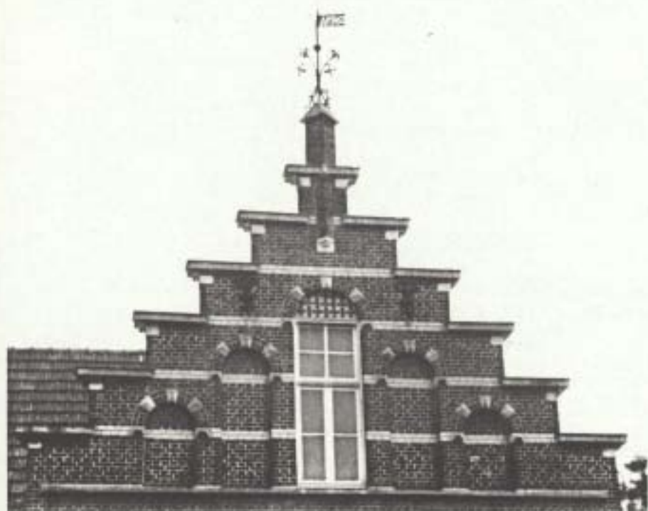
Op deze foto zijn de gebruikte sierelementen goed te zien

In 1896 wordt de school in gebruik genomen. In 1929 is het gebouw te klein. Het wordt uitgebreid met twee lokalen, in dezelfde bouwstijl. Het plan en de voorwaarden voor de uitbreiding worden opgemaakt door de Panningse architect J. Bongarts. De school wordt dan nog steeds bestuurd door het Parochiaal Armbestuur van Panningen.