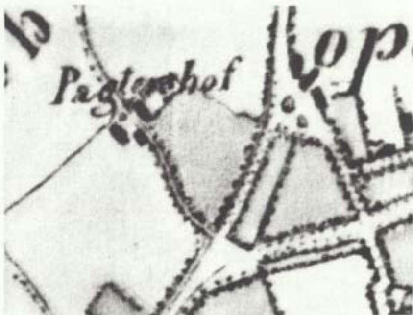
De toestand in 1806. Detail van de Tranchotkaart.